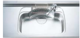
センターポケットシンク ※まな板スタンド付ワイヤーポケットはモデルチェンジしております。