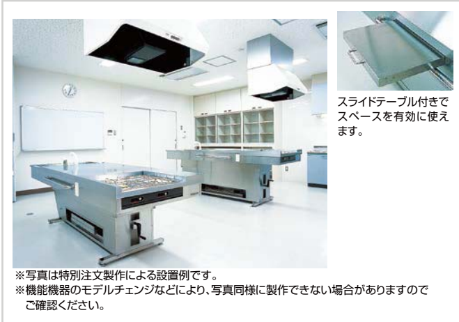
スライドテーブル付きでスペースを有効に使えます。

※写真は特別注文製作による設置例です。 ※機能機器のモデルチェンジなどにより、写真同様に製作できない場合がありますのでご確認ください。