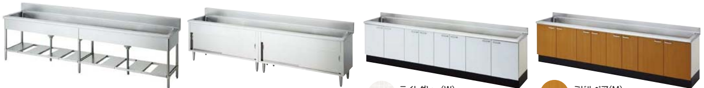
ライトグレー(W) 扉柄拡大